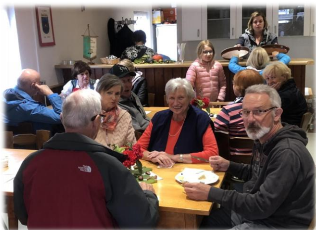
Oktoberfest: gemütliches Beisammensein

Am 3. Oktober fand unser traditionelles Oktoberfest statt. Das anfänglich etwas ungemütliche Wetter schreckte niemanden ab: Man traf sich am Häusle im Eichenweg, um miteinander zu plaudern, feine Leckereien zu verspeisen und eine gute Zeit miteinander zu verbringen. In fröhlicher Runde erfuhr man, was sich in der Hardecksiedlung tut. Allen Helferinnen und Helfern ein großes Dankeschön.